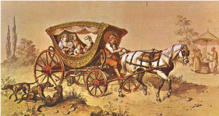
Osmanlı'da at arabası

Tarihçi İsmail Hakkı Uzunçarşılı ise Vecihî Tarihî 'ne yaptığı bir atıfla, Boşnak Salih Paşa'nın aslında padişahın tahttan indirilmesi konusunda çalışmalar yaptığı ve durumun Şeyhülislam Abdürrahim Efendi tarafından Valide Sultan'a bildirilmesi sonucu öldürüldüğünü, araba yasağı ihlalinin basit bir bahane olduğunu öne sürmektedir.