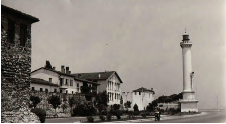
Ahırkapı Deniz Feneri

Bunun üzerine III. Osman bir fener yapılmasını emretmiş ve Kaptan-ı Derya Süleyman Paşa da Ahırkapı Feneri'ni yaptırmıştır.