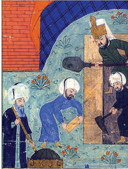
Osmanlı'da inşaat ustalarının çalışması

Dönemin padişahı Sultan II. Selim, Mimar Sinan'a şanına yakışır bir camii inşa etmesini buyurmuş. Sinan hemen kolları sıvamış Selimiye Camii'ni yapmaya başlamış. Temeller kazılmış, iskeleler kurulmuş... Çalışmalar sürerken Mimar Sinan bir gün elinde bir yumurta ile çıkagelmiş. Kendi kendine bir şeyler mırıldanıyormuş, aklından hesap yapıyormuş gibi bir hali varmış. Sonra eğilmiş ve yumurtayı inşaat kumuna kırmış ve başlamış karıştırmaya... Görenler şaşır-mış tabii. Bir müddet sonra: "Tüm inşaatta bu harcı kullanacağız." diye buyurmuş. Sırf bu harç meselesi için Edirne Karaağaç'ta bir çiftlik kurdurtmuş. 30.000 tavuğun her gün düzenli olarak yumurtaları toplanıp kumla ve kille karıştırılıp camide kullanılmış.