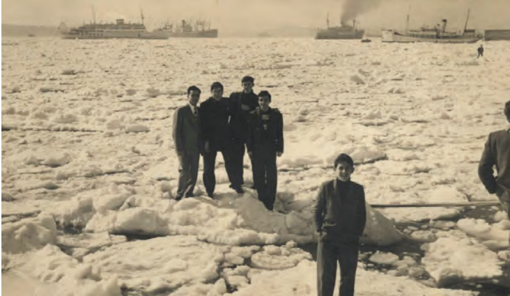
Boğaz'ın buzlarla kaplandığı gün

İstanbul 1954 yılında da tarihi kışlarından birini yaşamıştı. 25 Şubat sabahı İstanbul Boğazı'na bakan kent sakinleri gözlerine inanamamışlardı; Boğaz'da devasa buz parçaları yüzmekteydi ve Boğaz'ın bazı bölümleri ise tamamen buzlarla kaplanmıştı. Çok sayıda insan bu tarihi fırsatı kaçırmayıp, İstanbul Boğazı'nı yürüyerek geçiyor, bazıları ise buz parçaları üzerinde Türk bayraklarıyla pozlar veriyordu. Uzun yıllar önce yaşanan bu ilginç olayın kaynağı Tuna Nehri'ne uzanıyordu. Romanya'dan Karadeniz'e dökülen Avrupa'nın en uzun nehri, o kış donmuş ve üzerinde ulaşım yapılamaz hale gelmişti. Patlayıcılarla parçalanan buz parçaları Karadeniz boyunca sürüklenerek İstanbul Boğazı'na gelmişti. Boğaz'da sıkışarak birleşen bu parçalar Avrupa ile Asya kıtasını birleştirmişti.