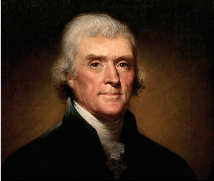
ABD'nin üçüncü Başkan'ı Thomas Jefferson

Philadelphia 'nın kaptırılması Amerikalıların küçük düşmesine neden oldu. Bunun üzerine, 16 Şubat 1804 tarihinde Amerikan donanması tarafından alınan ilginç ve radikal bir karar uygulanmaya kondu. Enterprise 'in kaptanı olan genç teğmen Stephen Decatur, Trablusgarb limanına girdi ve bir zamanlar Amerikan donanmasının en iyi gemilerinden biri olan Philadelphia 'yı kendi elleriyle ateşe verdi. Teğmen ülkesine döndüğünde bir savaş kahramanı olarak karşılanmıřtı.