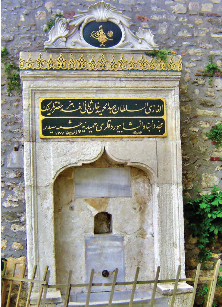
Topkapı Sarayı, orta kapı yanındaki ünlü Cellat Çeşmesi