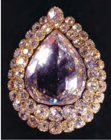
Kaşıkçı Elması (Topkapı Sarayı)

Kaşıkçı Elması'nın çevresini iki sıralı halinde 48 adet küçük ve 1 adet de tepede büyük pırlanta kuşatmaktadır.