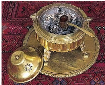
Mangalda Türk Kahvesi

Bu sırada ilginç bir olay yaşandı: Hazinelelerin yanında çuvallar dolusu çekilmemiş kahve bulunmaktaydı. Kahve çekirdeklerini gören Avusturyalılar gördükleri çekirdekleri başka bir şey zannederek "Türkler meğerse keçi pisliği yerlemiş" dediler ve kahve çekirdeklerini imha etmeye çalıştılar. Daha önce Osmanlı topraklarında yaşamış bir Viyanalı'nın kahve çekirdeklerini fark etmesi ve Avusturyalılara tanelerin ne işe yaradığını anlatması sonucunda Avrupalılar kahveyle tanışmış oldular.