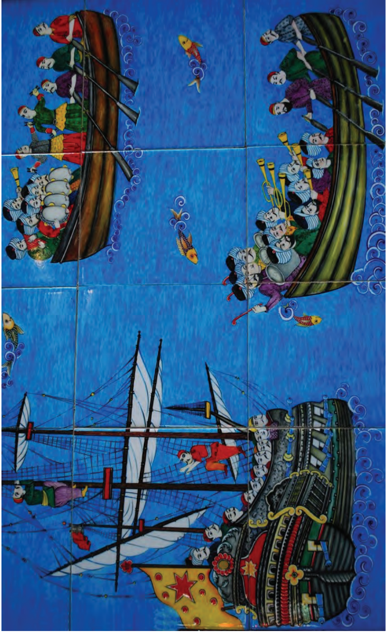
Osmanlı'da bir düğün minyatürü