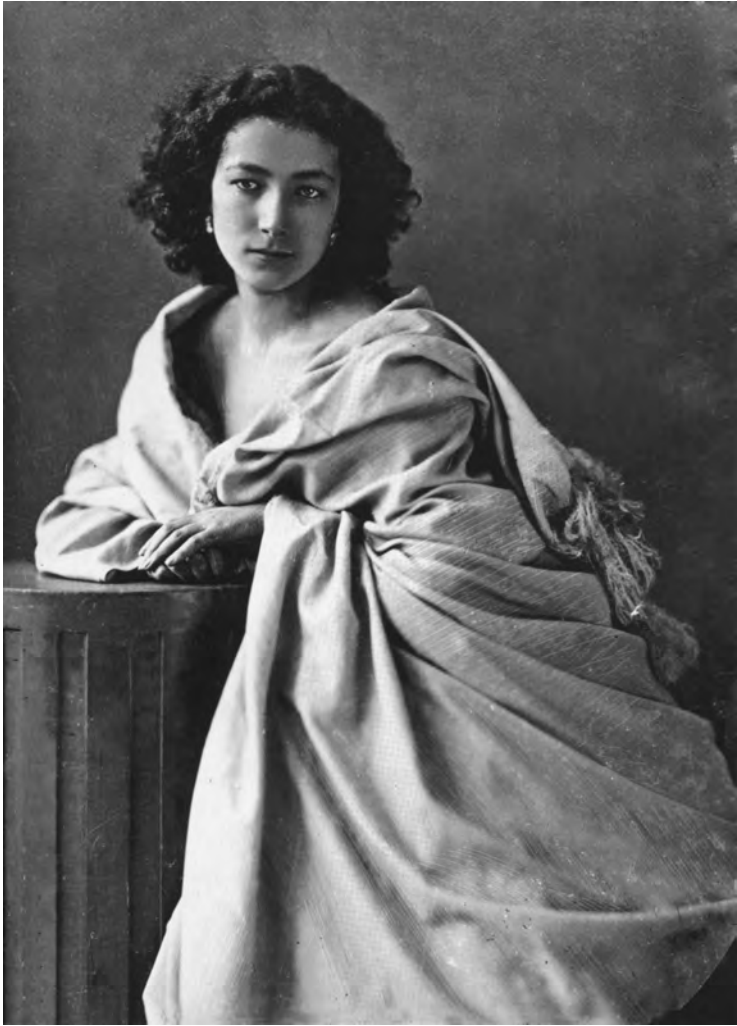
Nadar'ın objektifinden Sarah Bernhardt (1865)