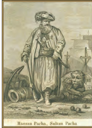
Cezayir Dayısı Gazi Hasan Paşa'nın Batılılar tarafından çizilen bir resmi

5-7 Temmuz 1770 tarihleri arasında yaşanan Çeşme Deniz Savaşı sırasında Kaptan-ı Derya Mandalzade Hüsamettin Paşa'nın yardımcısı olan Cezayirli Gazi Hasan Paşa bu savaşta gösterdiği yararlılıklar nedeniyle kısa sürede yükseldi ve III. Selim döneminde de Cezayirli Gazi Hasan Paşa adıyla sadrazam oldu. Bir lakabı da "palabıyık" olan Hasan Paşa son derece dürüst olmasıyla tanınırdı. Evcilleştirdiği aslanıyla İstanbul sokaklarında gezdiği zamanlarda dönemin fısıltı gazetelerinde her zaman manşette olan Hasan Paşa öldüğü zaman çok az bir mirası olabilecek derecede orta halli bir devlet adamıydı. Osmanlı-Rus Savaşı sırasında sefer masrafları için kendi cebinden 12.000 altın harcayacak kadar vatansever bir askerdi olan Hasan Paşa, aynı zamanda Cezayir Dayısı* olduğu dönemde ABD ile bir haraç anlaşması imzalamasıyla da ünlüdür.