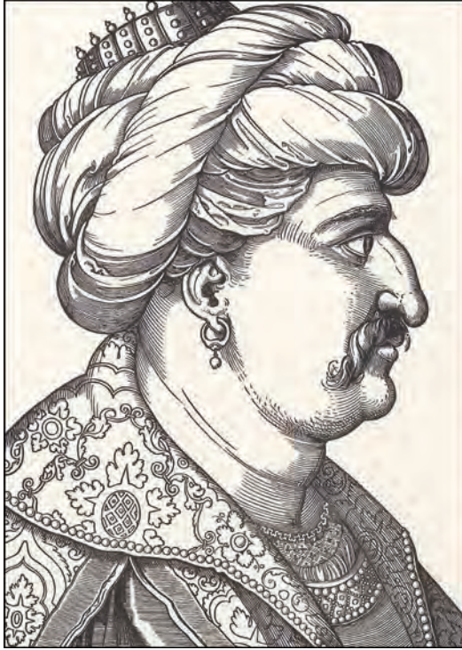
Yavuz Sultan Selim (Çizen: Erhard Schön - 1534)

Ataları hep sakal uzattıkları halde, Yavuz Sultan Selim sakalını keserdi. Bunun sebebini soranlara “Sakalımı ele vermemek için kesiyorum” dediği rivayet edilir. Bir kulağına da küpe takardı. Son dönemlerde Yavuz’un küpeli görüldüğü resimlerin aslında Şah İsmail’e ait olduğu da iddia edilmektedir; ancak Yavuz’un küpe taktığını iddia edenler de, tersini iddia edenler de çok sağlam kanıtlara sahip değildir. Yavuz 22 Eylül 1520’de “aslan pençesi” denen bir çıban yüzünden, henüz 50 yaşında iken vefat etti.