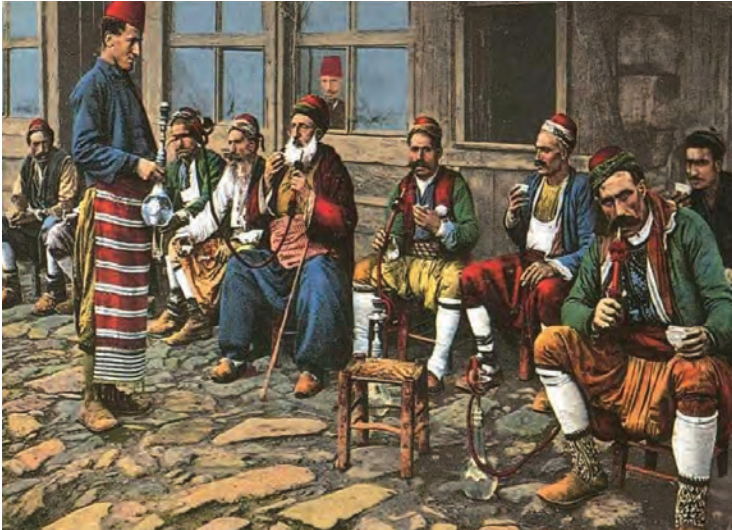
Kahvehanede nargile ve tütün içenler

Bağdat Seferi sırasında bir gün gayet güzel cins bir at, üzerinde son derece kıymetli eyer takımı ile bağlandığı yerden boşanmış, başı boş gezen dolaşan padişahın otağı önüne kadar gelmişti. Orada yakalanan hayvan, sahibinin bulunması için tellala verilip ordu içinde gezdirilmiş ve kimse hayvana sahip çıkmamıştı. Bunun üzerine şüphe uyanmış, üzerindeki eyer araştırılmış, iç tarafta, gizli bir göz içinde bir tütün lülesi ve bir kese tütün bulunmuştu. Sahibinin başı korkusundan hayvanı feda ettiği anlaşılmıştı.