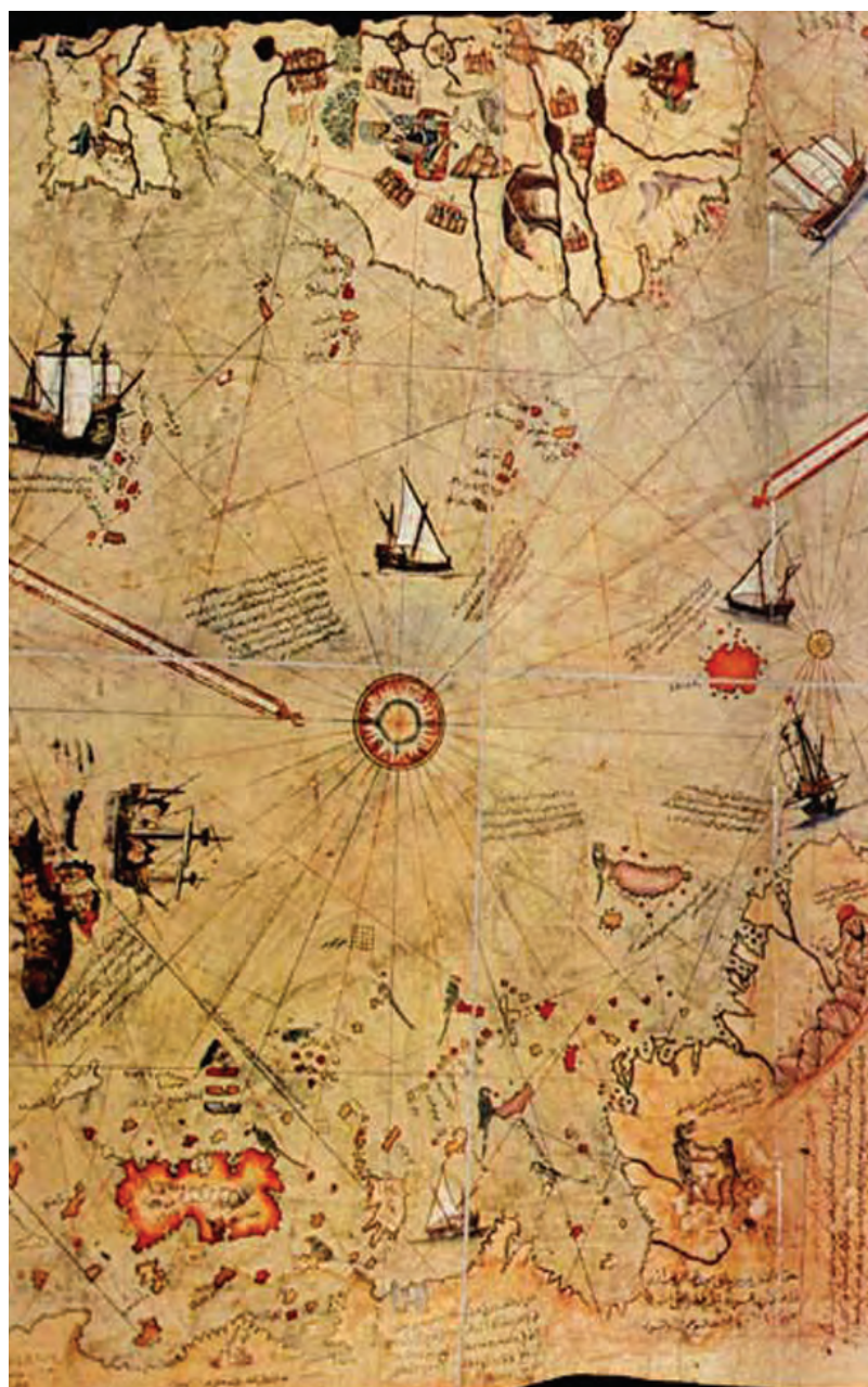
Piri Reis tarafından çizilen ilk Dünya haritalarından bir pafta