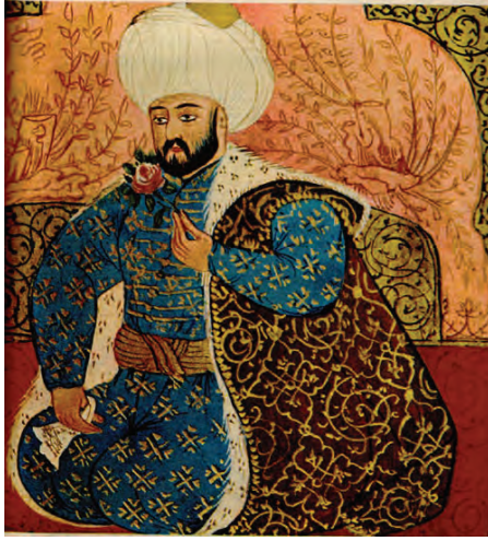
Fatih Sultan Mehmet

Fatih Sultan Mehmet tahta çıktığı zaman bir kuyruklu yıldız görülmüştü ve Papa o zaman yıldızı “Türk ve Müslüman dostu zındık yıldız” olarak aforoz etmişti. Sonradan, bu kuyruklu yıldızın Halley kuyruklu yıldızı olduğu öğrenildi. Balkan Harbi’nde (1912) Bulgarlar Çatalca’ya kadar ilerlerken Halley kuyruklu yıldızı yine görülmüştü. O zaman kilise adamları: “Türklerin uğur yıldızı görüldü, Bulgarlar yine mağlup olacaklar!” demişti ve gerçekten de öyle oldu. Çatalca Muharebesi’ni kazandık, Balkanlı müttefikler arasına nifak girdi ve Edirne’yi Bulgarlar’dan geri aldık.