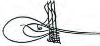
II. Selim'in Tuğrası

Sumatra adasındaki en büyük kilisenin çanı eski bir Türk topundan yapılmıştır ve üzerinde II. Selim'in tuğrası vardır. 1570 yılında Sumatra'dan gelen bir istek üzerine oraya gönderilen silahlar arasında Açe elçisinin II. Selim'e hediye olarak verdiği bir torba Sumatra biberine ithafen, 'lada seçupak' (bir torba biber) adlı dev top da bulunmaktaydı. Bu top 16'ıncı asırda Sumatra Müslümanlarına yardım için İstanbul'dan gönderilen Türk döküm ustaları tarafından orada dökülmüş, üzerine de bu ada Müslümanlarının Osmanlı'ya tabiiyetinin alâmeti olarak bu padişahın tuğrası konmuştu.