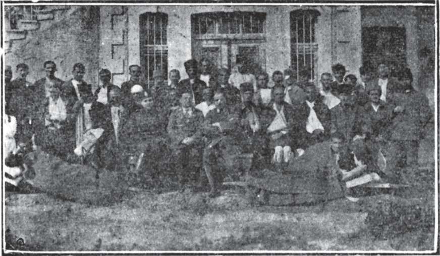
Konya Mecnûhîn Hastahânesinde zâbitândan bir grup

teşkil edilmiş ve sekiz ay müddetle muhtâcîn ve muhâcirînin imdâdına yetişilmiştir. Hey'et Konya, Ereğli, Bor dispanserlerinde sıtma ve frengi mücadelesini de uhdesine almış ve bu münâsebetle elli kiloyu mütecâviz kinînle bine yakın miktarda neoselvarsan(?) sarf etmiştir. Konya Hastahânesi bakteriyoloji laboratuvarı ile Ereğli ve Bor dispanserlerinde mevcûd hardebînler(?) i'ânesiyle binlerce tahlilât-ı hardebîniye yapılmıştır. (17)