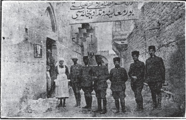
Adana İmdâd-ı Sıhî Hey'eti Bor Muâyene ve Tedâvîhânesi