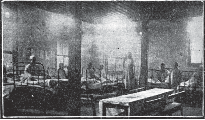
Adapazarı Hilâl-i Ahmer Sekizinci İmdâd-ı Sıhî Hey'eti Hastahânesi'nden Bir Koğuş

büyük bir sefâlet ve mahrûmiyete maruz kalmaları hasebiyle Hilâl-i Ahmer Merkez-i Umûmîsi'nden bu felâketzedeleri iâşe ve hastalarını tedâvî etmek üzere Karamürsel Sekizinci İmdâd-ı Sıhî Hey'eti göndermiş ve Hey'et Anadolu'ya (35) duhûlünü müteâkip bi't-tabî Ankara Murahhaslığı emrine girmiştir.