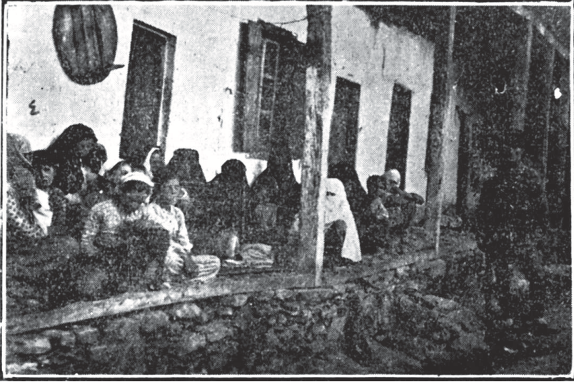
Haymana Muhacirlerinden Bir Grup

olduğu gibi buralarda da bütün köylünün eşyâ ve mevâşisini gasp ve zabt ile berâber alıp götürmüşlerdir. Kadınların zî-kıymet eşyâ ve mücevherâtını katl tehdîdâtıyla cebren almışlar, vermekte teehhür edenleri öldürmüşlerdir.