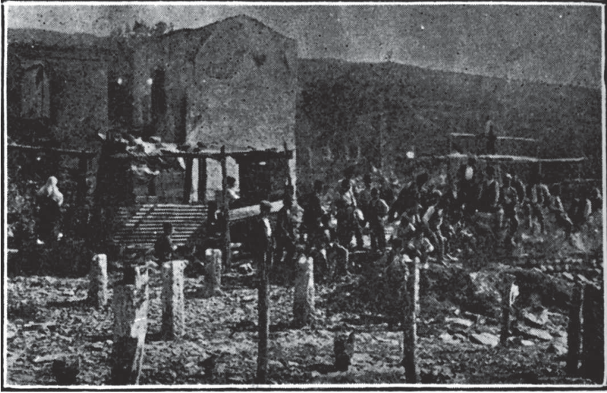
Yunanlılar tarafından yakılan Bilecik Şehri'nden Bir Manzara.

Hey'et berâberinde 10.000 lira, 56.500 kilo un, 20 teneke petrol, 200 kat çamaşır götürmüştür. İmdâd Hey'eti vazîfesini (37) hakkıyla görebilmek için evvelâ tahrîb edilen menâtukda tetkîkât icrâsıyla felâket ve sefâletin derecesini anlamak ve bu sûretle en ziyâde muhtâc-ı muâvenet olanların miktarını tesbit etmek lüzûmunu hissetmiştir.