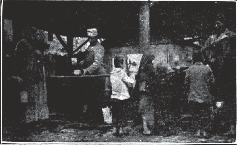
Hilâl-i Ahmer Beşinci İmdâd-ı Sıhî Hey'eti Âşhânelerinden