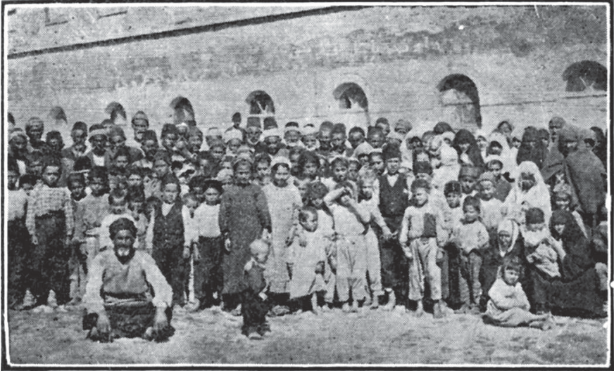
Sakarya Havâlsi Muhâcirîninden Bir Grup

300 hâne- 4 yanmamış. Bu, serveti üzüm bağlarında olan büyük, mamûr bir köydü. Bağlar köyden biraz uzak ve dağ eteğinde oldukları için kısmen tahrîb edilebilmiş. Evlerin bir çoğu üç kat imiş. Köyün medhalinde ( girişinde ) içinde bir çeşme ve ağaçlar olan güzel bir meydan varmış. Köyün duvarları pek fenâ tahrîb edilmiş. Câmî'in yalnız minâresi kalmış. Köylüler kaçarlarken bazıları yakalanarak ırzlarına tecâvüz edilmiş. Genç adamlar kadınları müdâfaa ederlerken öldürülmüşler.