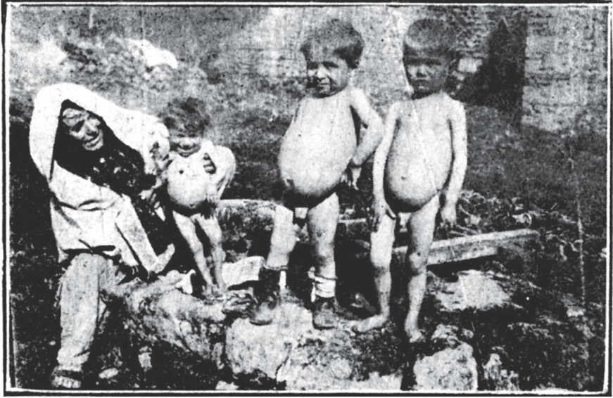
Antalya Dispanserimizin Hastalarından: Sıtmalı Çocuklar.

Bu havâlide ilk zamanlarda yüz bine karîb ( yakın ) bir yekûn teşkil eden mültecilerin yavaş yavaş imkân ve vesâit buldukça daha içerilere doğru çekilip muhtelif menâtukta yerleşmeleri hasebiyle miktarları tahmînen elli bine inmiş, nihâyet bu miktar tedrici sûrette daha ziyâde tenezzül etmiş bulunmakla ona nazaran hey'etin teşkilâtı da tenkîs edilerek Burdur Hastahânesi malzemesinin büyük bir kısmıyla cihet-i askeriyeye devir ve Yenipazar'a 28 verilen Bozdoğan 29 ve Bağarası 30 dispanserleri lağv olunmuştu. Böylece mesâînin devamı hengâmında ve hey'etin ifâ-i vazîfeye ibtidâ'rının tam yirmi dördüncü ayında Afyonkarahisar, Kütahya, Eskişehir ve Sakarya muhârebâtı başlamış ve bu muhârebâta sahne olan menâtuk gerisinde daha had vazîyetler hudusüyle daha müsta'cel ve vâsî' mesâînin lüzûm-ı vücûbu zaruretinin husûlüne binâen Burdur,