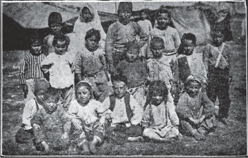
Yunanlılar tarafından Gördes'te Babaları Öldürülen Çocuklar

Hey'et Gördes'te feci bir manzarâ-i mâtem ve felâket karşısında bulunmuştur. Köyde yanmamış hiçbir ev kalmamıştı. Herkes duvar kenarlarında, ağaçlardan yaptıkları çadırlar içinde barınmak istiyorlar. Bunlardan ekserisi açlıktan baygın bir halde yatıyordu.