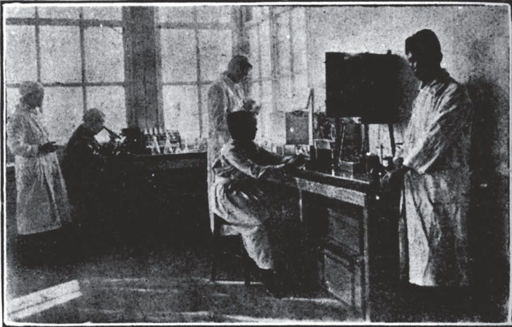
Konya Mecrûhîn Hastahânesi'nde Bakteriyoloji Laboratuvarı

Hey'et Bor Dispanseri'nde açtığı bir aşhâne ile kışın en şiddetli zamanında iki ay müddet yevmi dört yüze karîb ( yakın ) en muhtâc muhâcirîni it'âm ettiği ( doyurduğunu ) gibi Pozantı-Kelebek hattı güzergâhındaki en aç muhtâcîn-i muhâcirîne de on bin kilo un tevzî' etmiştir. Bundan mâ-adâ Gördes felâket-zedegânı nâmına on beş bin kilo tuz mubây'e ederek Kütahya Mutasarrıflığı nâmına göndermiştir.