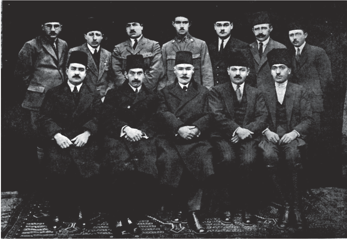
Ankara Hilâl-i Ahmer Hey'et-i Murahhasası Erkân ve Me'mûrîni