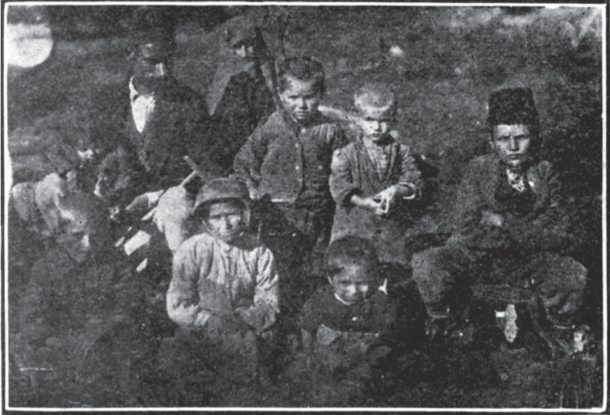
Ebeveyni Yunanlılar Tarafından Öldürülen oniki Yaşında Bir Aile Reîsi

Köyü dolaşırken harâbelerden kadınlar çıkıyor, gidip evlerini görmemizi ricâ ediyorlardı. Bir kadın bizi harap olan evine götürmekte ısrâr etti. “ Bakın ” dedi: “ On iki odalı ne güzel evim vardı. ” Biz yıkık on iki odanın harâbesinde aşağı yukarı dolaşırken o acı acı ağlayarak: “ Acaba bir daha böyle bir evim olacak mı? ” dedi. Bu kadın da: “ Bizden evvelâ ne istediler ise verdik, fakat ne faydası oldu ki! Bakınız evlerimize! ” dedi.