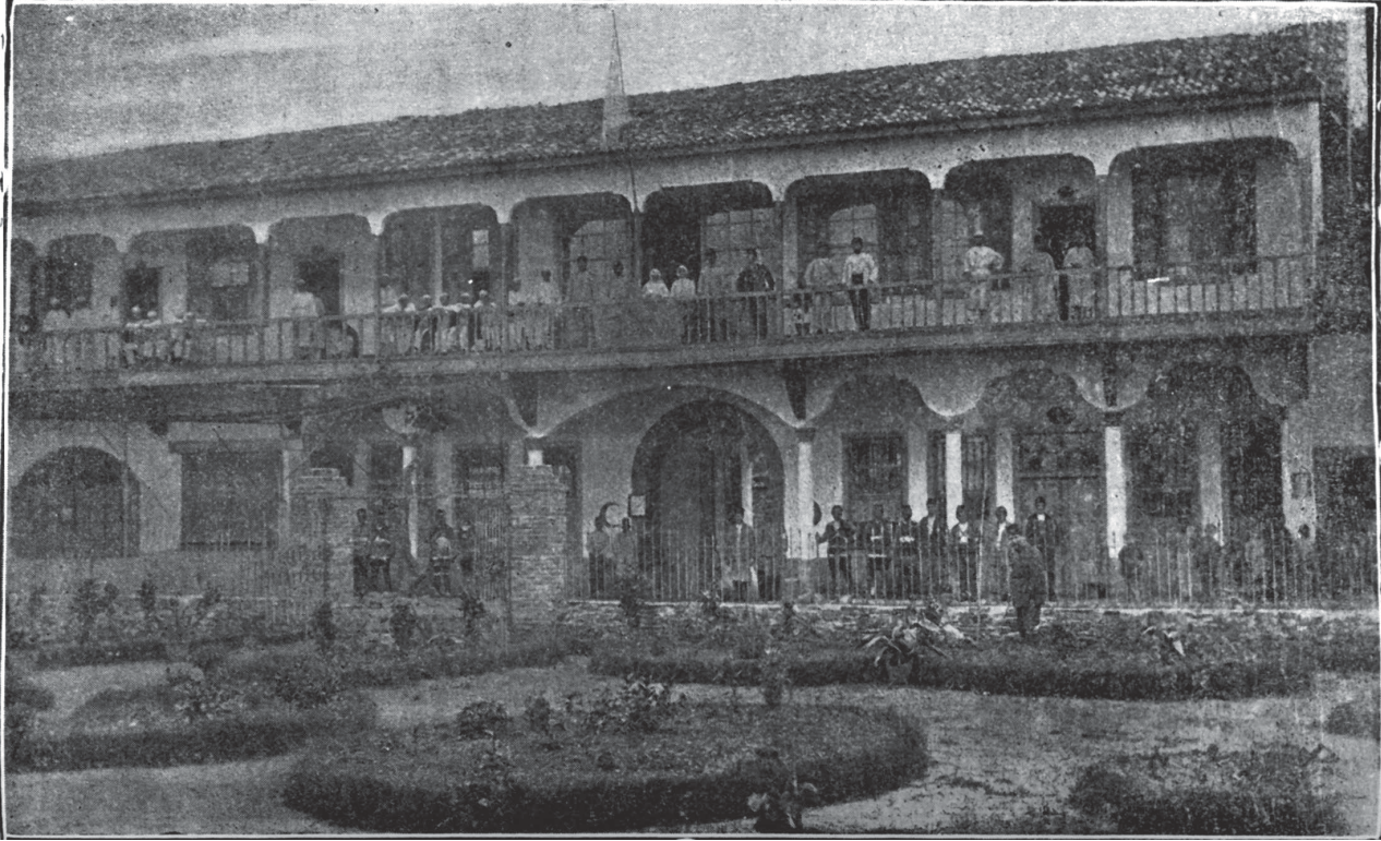
Hilâl-i Ahmer Beşinci İmâd-ı Sıhî Hey'eti Nâzillî Muhâcirîn Hastahânesi