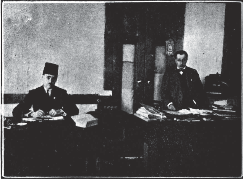
Hilâl-i Ahmer Ankara Hey'et-i Murahhasası Userâ Şu'besi Mu'âmele Odası

Bu hastahâne Mayıs 337 (M. 1921) evâsıtında (ortalığında) iki yüz yatak üzerine yeniden sûret-i mükemmele ve muntazamada tertîp ve ihzâr edilmiş ve bu sûretle bir numûne hastahânesi hâlinde 19 Temmuz 337 târihine kadar icrâ-i fa'âliyet ederek o târihte vazîyet-i askeriyeden dolayı Kırşehir'ne nakil ve orada te'sîs edilmiştir. Bu hastahânemizde tedâvî edilen mecrûhînin adedi raporun nihâyetindeki cetvel-i mahsûsunda görülecektir.