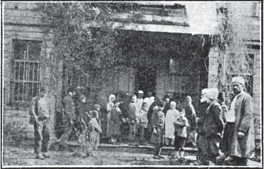
Adapazarı'nda Hilâl-i Ahmer Sekizinci İmdâd-ı Sıhî Hey'eti binâsı.

Alaşehir'in Haziran 336 (M. 1920)'da Yunanlılar tarafından işgali esnasında Hey'et-i Hilâl-ı Ahmer hâiz olduğu beyn-el-milel sıfat ve vaz'iyetine güvenerek Alaşehir'de kalmış, etibbâ ( doktorları ) ve me'mûrîni ( memurları ) Yunanlılar tarafından esir edilmiştir. Bil'âhire, o sırada Trabzon'da vazîfe-i insaniyet-kârâne yerine teşvikât ve tahrikât-ı siyâsiyede bulunan Yunan Salîb-i Ahmer hey'etiyle Büyük Millet Meclisi Hükûmeti tarafından vâkî' olan teşebbüs üzerine mübâdele edilmiştir.