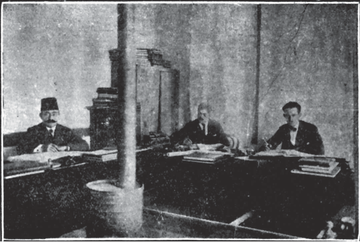
Hilâl-i Ahmer Ankara Murahhasası Muhâsebe Odası

Roma'daki mümessil Câmî Beyefendi 17 vesâtatıyla Ankara Murahhaslığı'na irsâl edilmiş olduğu gibi Bingazi ve Trablusgarb'da cem' edilen iki yüz dört bin İtalyan Frankı dahî veznemize irsâl edilmiştir. Bundan başka Mısır Hilâl-i Ahmeri tarafından toplanan mebâligden otuz yedi bin iki yüz elli liranın te'diye ( ödeme ) emri bu raporun yazıldığı sırada vürûd etmiş idi.